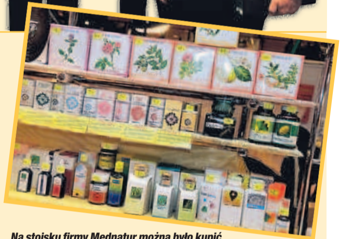
Na stoisku firmy Mednatur można było kupić kilkaset preparatów i suplementów diety. ▲