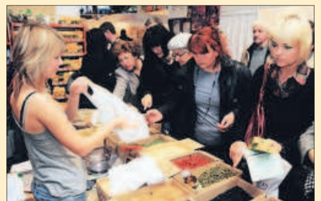
Naturalne przyprawy, pachnące herbatki to nie tylko smaczne posiłki, ale i dawka zdrowia.