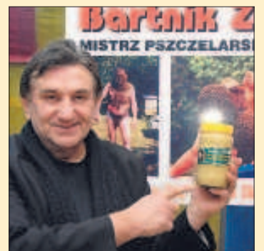
Na na stoisku Bartnika Żuromińskiego przebojem była pierzęga w miodzie.