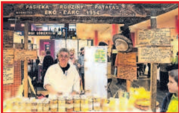
Na stoisku pasieki Eko Barć królowały miody w rozmaitych smakach i postaciach.

Olejki do masażu ciała to nowość firmy Ziaja, która świętowała dwudziestolecie istnienia. ▶