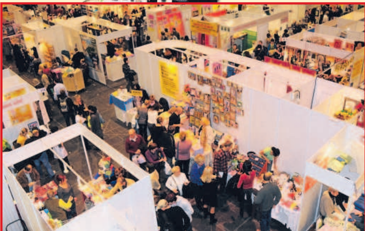
Tysiące osób przyszło na XVIII Festiwal Zdrowia i Niezwykłości.